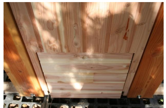
TRAPPE DE RECUPERATION A L'ARRIERE DE LA CABINE