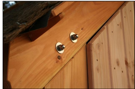
ECROUS BORGNES INOX