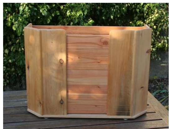
RESERVOIR A COPEAUX