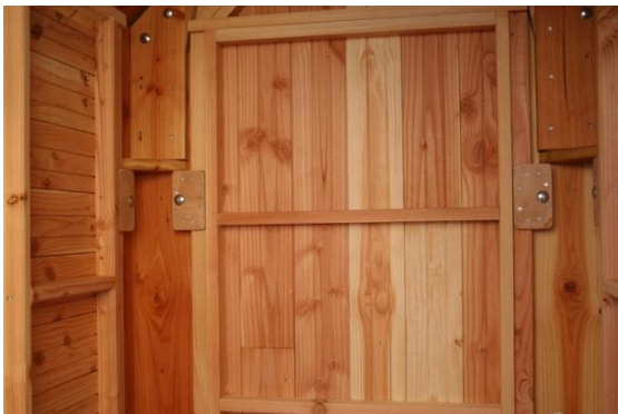
FIXATIONS PAR BOULONNAGE